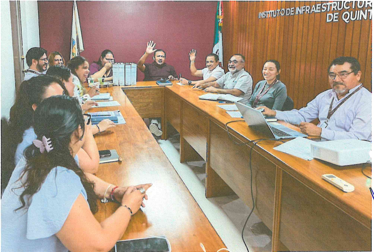
Esta hoja de imágenes fotográficas, corresponde al acta de la Primera Sesión Ordinaria del COEPCI del del IFEQROO, que se realizó el día 19 de marzo de 2026.